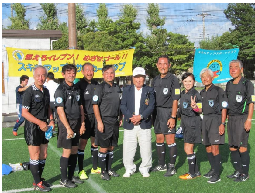
大会を無事に終えたRA東京審判メンバー